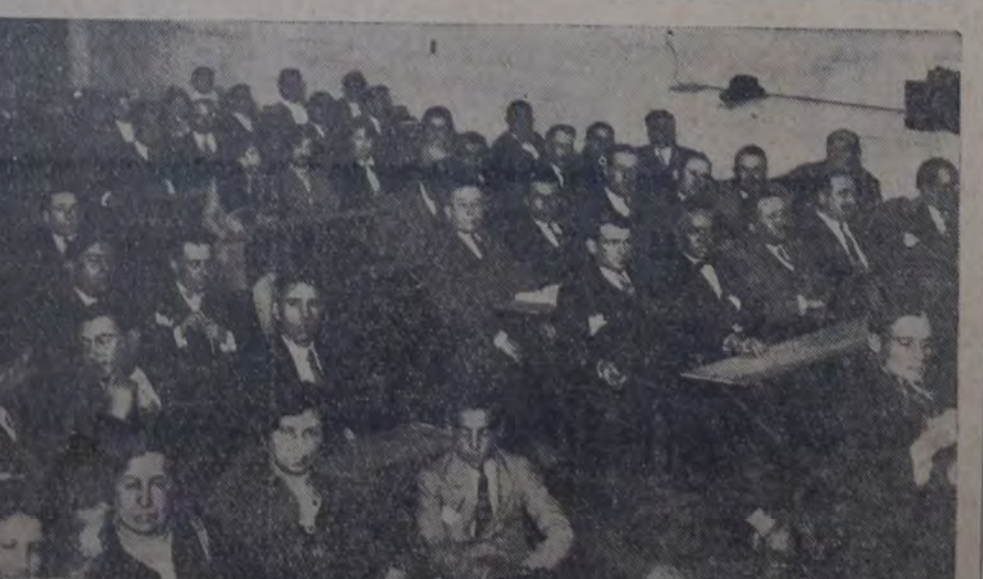
EN EL LOCAL DE LA SECCION BUENOS AIRES DE LA UNION FERROVIARIA SE LLEVO A CABO AYER una hermosa fiesta, organizada por la comisión pro edificio social, en honor de los delegados al Congreso