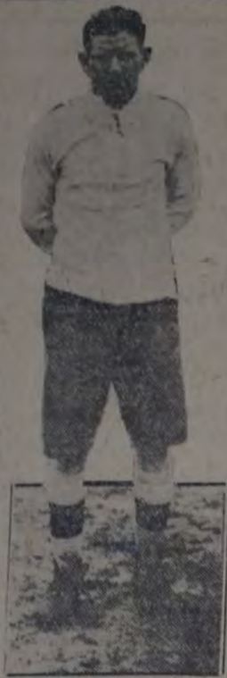
QUE AYER FUE EL SCORER DEL EQUIPO ARGENTINO EN AMSTERDAM: marcó 4 de los 11 tantos registrados por su cuadro frente a los norteamericanos