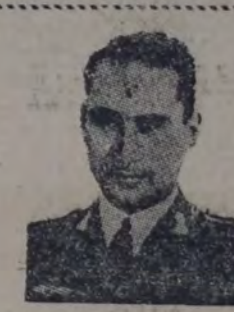
PILOTO DEL "JESUS DEL GRAN PODER"

El aparato arrancó a las 11.19, elevándose poco después majestuosamente.