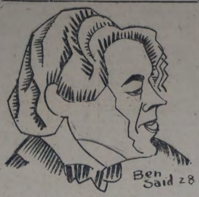
YVES NAT, EXCELENTE PIANISTA FRANCÉS QUE AYER PRESENTOSE ante nuestro público en el Ateneo